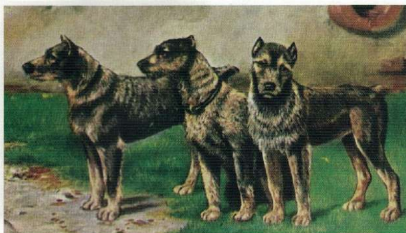
Objavljeno v Showsight Magazine, junij 2014

Sprva evropski premožnejši sloji niso kazali posebnega zanimanja za tega grobega, uporabnega podeželskega psa, sredi 19. stoletja pa je pritegnil pozornost nemških ljubiteljev psov in začel se je bolj sistematičen načrtni vzrejni pristop. Psi tega obdobja so bili sprva po videzu zelo neenotni: v istem leglu so se pojavljali ostro in gladkodlaki mladiči, razpon višine in teže je bil velik, pojavljale so se tudi nenavadne barve in druge razlike.