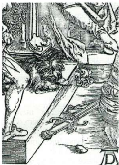
Albrecht Dürer, lesorez, 15. stoletje

Predniški tip šnavcerja je bil dovolj velik, da je varoval dom in kmetijo, priganjal živino na trg ter uničeval škodljivce, hkrati pa ne tako velik, da bi porabljal omejene vire. Stoletja dolgo so jih vzrejali izključno zaradi njihove uporabnosti za človeka. Natančni velikosti ali telesni zgradbi niso posvečali posebne pozornosti, dokler je le ta uspešno opravljal svoje delo. Bili so trpežni, žilavi, vzdržljivi in vodljiv psi. Čeprav so predstavljali prepoznaven 'tip', še niso bili pasma in v nobenem sodobnem pomenu besede niso bili 'čistokrvni'.